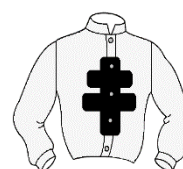
Croix de Lorraine