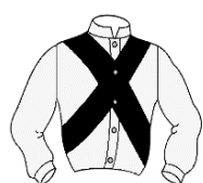
Croix de St-André