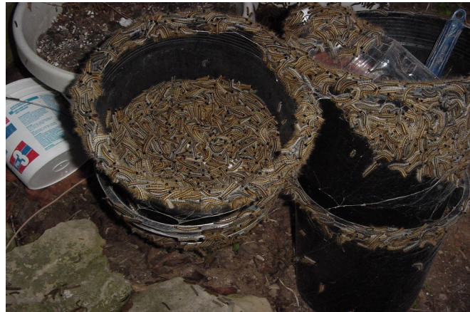
Abb. 1 und 2 Massive Zunahme von Eastern Tent Caterpillars (ETCs) in Kentucky im Jahr 2001, die überall rum krochen, kübelweise eingesammelt werden konnten und vermutlich zu Vergiftungen bei den Pferden führten.